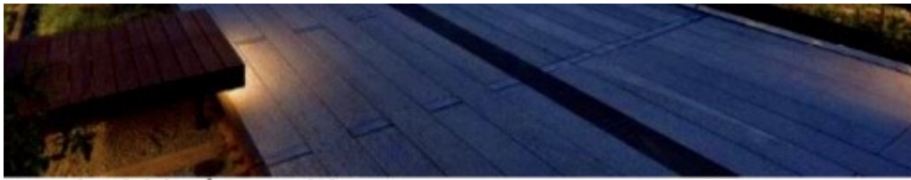
Regurbekkir á svæðinu