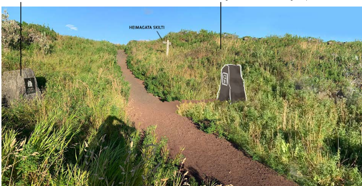
Tillaga að staðsetningu. Steinn með áletruðum platta og malarstígur að honum, sambærilegt við þann sem er á móti.