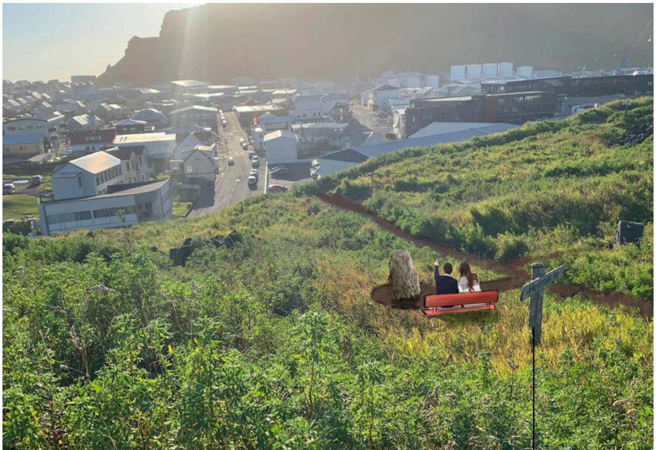
HEIMAGATA - skilti