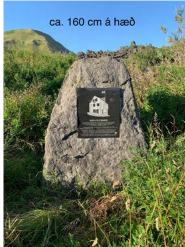
Herjólfsbær - Oddfellow